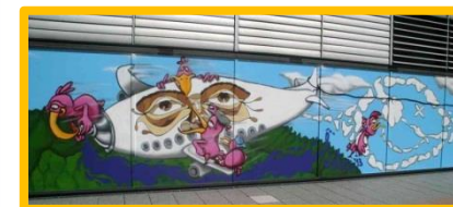
Professionelle Neugestaltung der Turnhallenfassade (07/2013)