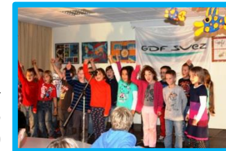
Finanzierung des Neubaus einer mobilen Bühne für den Speisesaal (09/2013)