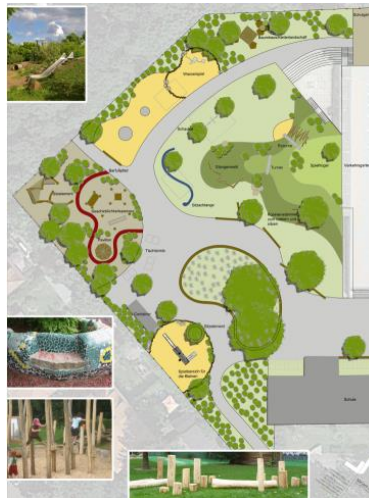
Plan des neuen Schulhofes - Projekt „Grün macht Schule“