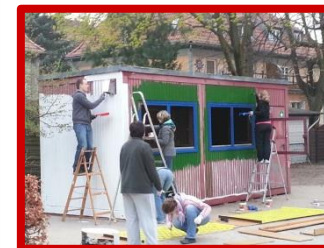
Beschaffung eines Baucontainers und Umgestaltung zur Spielausleihstation. (02/2014)