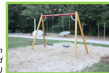
Finanzierung der neuen Doppelschaukel und Sonnensegel (09/2013)