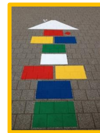
selbst entworfene und gemalte bunte Bodenspiele auf dem Schulhof (09/2013)

In den letzten zwei Jahren haben wir eine Vielzahl von Projekten umsetzen können. Hier ein paar Eindrücke unserer erreichten Sonderflugziele: